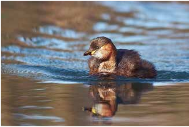
(7) Der Zwergtaucher ist mal über und mal unter Wasser unterwegs.