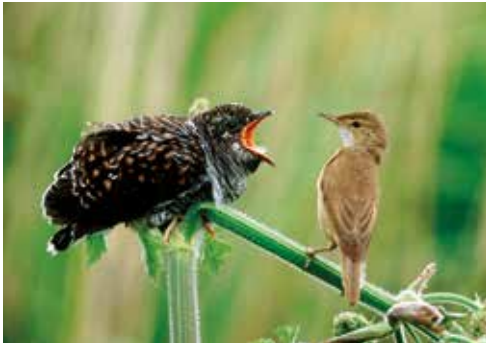
(1) Nicht selten werden Teichrohrsänger (rechts) unfreiwillig Eltern des Kuckucks .