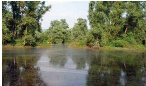
(9) Zeugen des Tonabbaus: Die flachen Stillgewässer sind ideale Lebensräume für Amphibien. Im flachen Wasser der Ufer gehen Watvögel auf Nahrungssuche.