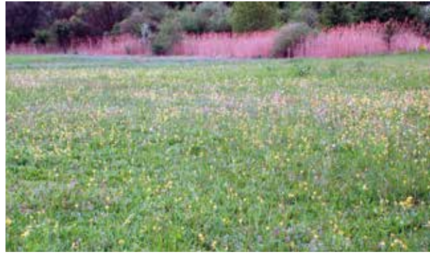
(8) Im zeitigen Frühling blühen im Naturschutzgebiet hunderte Wiesen-Schlüsselblumen .

Rund 90 Brutvogelarten konnten die ehrenamtlichen Gebietsbetreuer des NABU hier nachweisen. Darunter Zwergtaucher , Neuntöter , Eisvogel sowie viele Enten- und Greifvogelarten. Zu den Brutvögeln kommen – verteilt über das ganze Jahr – Nahrungsgäste wie Rohrweihe und Schwarzstorch sowie als Zug- und Wintergäste Grünschenkel , Waldwasserläufer und Silber- , Seiden- und Purpureiher . In den Tümpeln laichen verschiedene Frösche, Kröten und Molche, auch die Ringelnatter kann hier beobachtet werden.