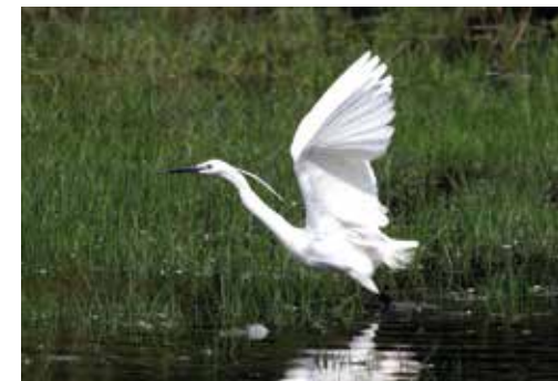
(6) Der Seidenreiher nutzt das Tongrubengelände zur Nahrungssuche.