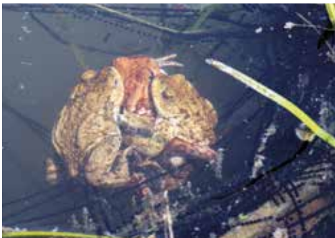
(3) Erdkröten laichen neben anderen Amphibienarten in den Stillgewässern.