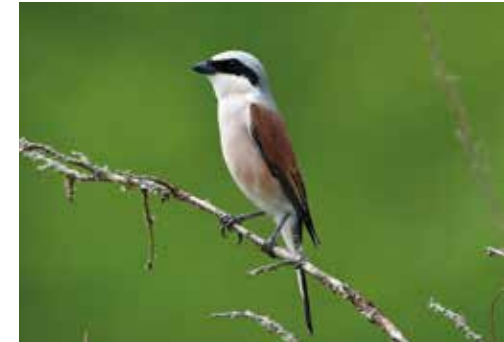
(4) Der Neuntöter bevorzugt die Hecken, dort speißt er seine Beute auf Dornen auf.