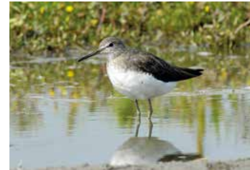
(5) Der Waldwasserläufer hat sein Brutgebiet in Skandinavien und Ostsibirien. Er macht hier Rast auf seinem Zug.