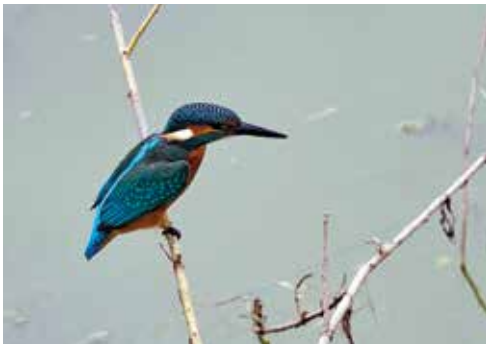
(2) Der Eisvogel ist gut an seinem bunten Gefieder zu erkennen. Pfeilartig taucht er nach kleinen Fischen.